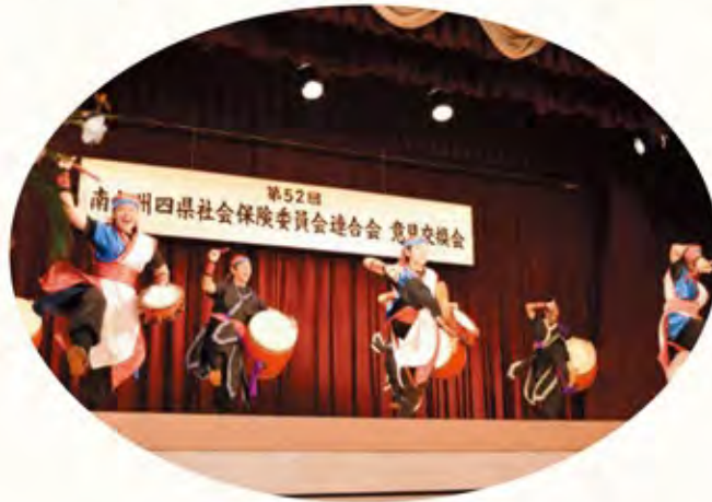
創作衆「桜輝」の皆さま

創作衆「桜輝」による琉球太鼓が、躍動感あふれる演武と圧倒的な迫力の太鼓の響きで演じられました。