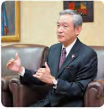
■金城棟啓氏 1954年生まれ 1977年4月 琉球銀行入行 2012年4月 頭取就任 2017年4月 会長就任（現職） 2013年3月 沖縄県社会保険協会 会長就任 他数多くの団体役員兼任