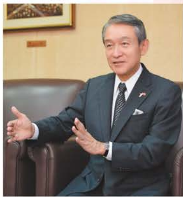
■金城棟啓氏 1954年生まれ 1977年4月 琉球銀行入行 2012年4月 頭取就任 2017年4月 会長就任（現職） 2013年3月 沖縄県社会保険協会 会長就任 他数多くの団体役員兼任